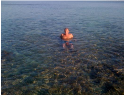
Isola dei Conigli

In mattinata con dispiacere abbiamo lasciato Punta Suina in direzione di Gallipoli dove siamo giunti ed abbiamo fatto provviste in un supermercato per poi dirigersi come indicato dal navigatore verso l'aera sosta situata nel porto ma gli stalli erano tutti occupati da alcuni camper ed auto e per il nostro 7mt non c'era assolutamente posto pertanto visto il problema sosta ed il traffico caotico della città abbiamo optato per il proseguimento del viaggio sempre lungo le strade della costa alla ricerca di angoli di mare belli, pranzo in prossimità di Sant'Isidoro. Giunti a Porto Cesareo nel pomeriggio abbiamo parkeggiato in fondo al piazzale del porto