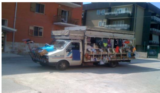
Caratteristico mezzo che circola in puglia

5/8/2013 al mattino con paese (dista circa 1 km) di viveri ma sulla via del bassissima velocità causa lastroni di porfido bagnati grave solo piccole all'AA spiaggia e bagni. La paese perché c'era la notte piazza e nelle vie del negozi tutti aperti; rientrati