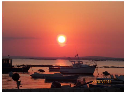
Tramonto A Porto Cesareo visto dal camper