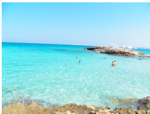
Mare di Punta Suina

Dopo la sosta di Mancaversa ci siamo spostati di pochi km per raggiungere Punta Suina in quanto ci avevano parlato molto bene del posto descrivendolo stupendo ed infatti avevano pienamente ragione il posto è spettacolare con acqua cristallina, dal parcheggio N-40.002191 E-018.01896 a pagamento 10€ giorno (si può sostare anche la notte e chiudono la sbarra ma vi è un guardiano nella pineta) attraverso una pineta si raggiunge una spiaggia di sabbia e scogli con mare sempre più splendido non