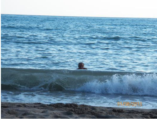
Il mare di Palinuro