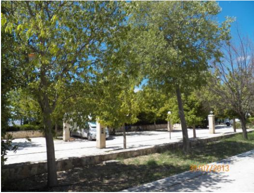
Area sosta agricampeggio

MASSERIA DEL PANTALEONE dove hanno una quindicina di posti per camper molto belli