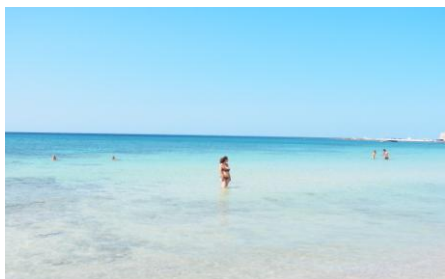
Il mare di Torre Pali

alcuni punti c'erano persone che facevano i tuffi da queste rocce superata Leuca la costa cambia perché si alternano tratti con scogli e tratti con spiaggia ci siamo fermati a vedere le Maldive del Salento a Marina di Pescoluse splendido il mare e la spiaggia ma pieno di stabilimenti e quindi pochissimo spazio per la spiaggia libera, quindi stavano uno attaccato all'altro e pertanto abbiamo proseguito e circa dopo 4km (Torre Pali) abbiamo notato alcuni camper ed